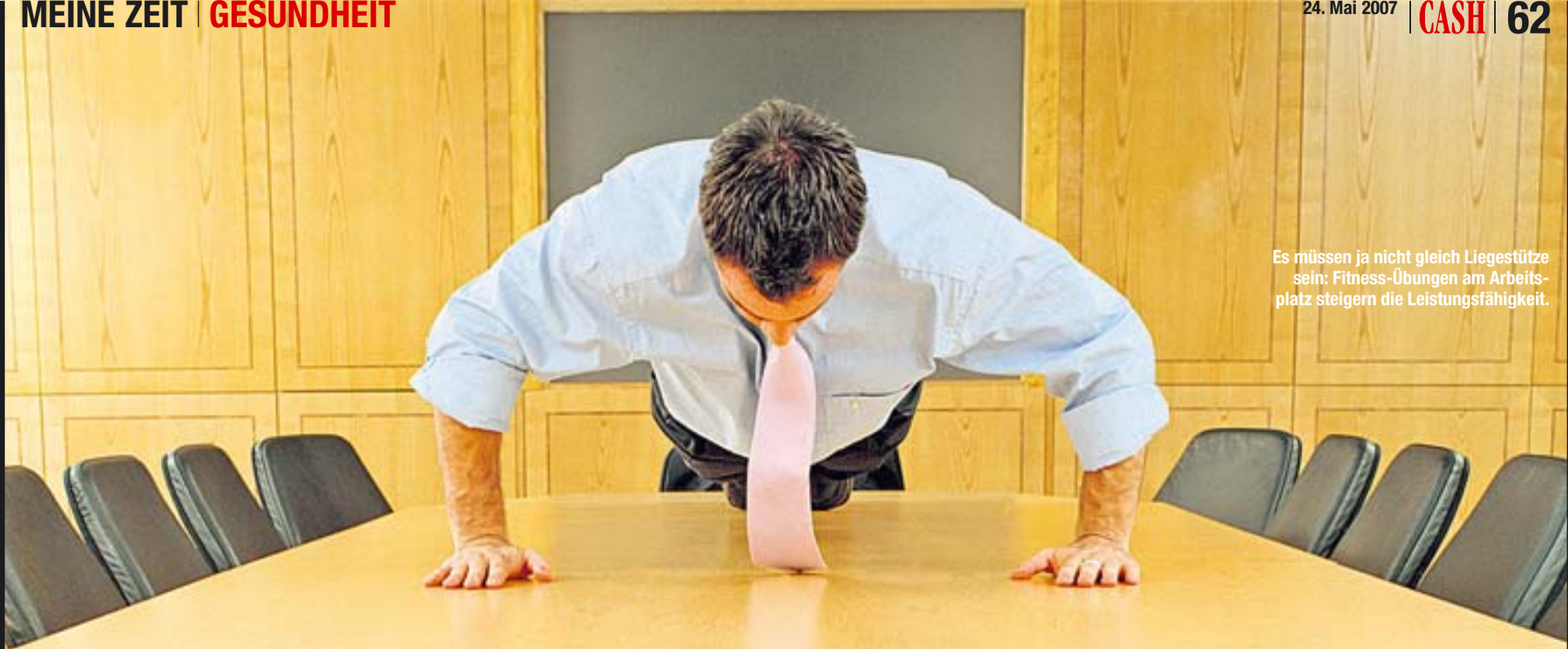
Es müssen ja nicht gleich Liegestütze sein: Fitness-Übungen am Arbeitsplatz steigern die Leistungsfähigkeit.